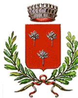
COMUNE DI FIORENZUOLA D'ARDA